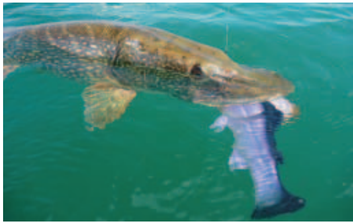
Sicher gehakt (l.), und so kann Herbert den Kapitalhecht mit 113 Zentimetern wenig später präsentieren (u.).

Im Hafen luden wir die Fische aus und aßen erstmal im nahen Restaurant. →