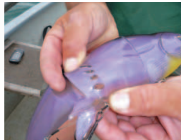
Lila macht die Hechte verrückt: Bisspuren auf einem Real Bait in der Farbe „Mad Shad“.

Grüezi mitenand: Wir passieren Steckborn auf der schweizerischen Seite des Untersees.