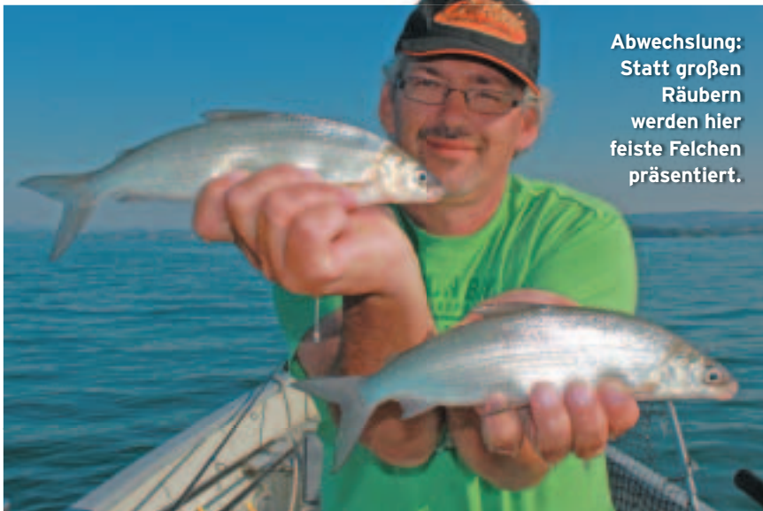
Abwechslung: Statt großen Räubern werden hier feiste Felchen präsentiert.