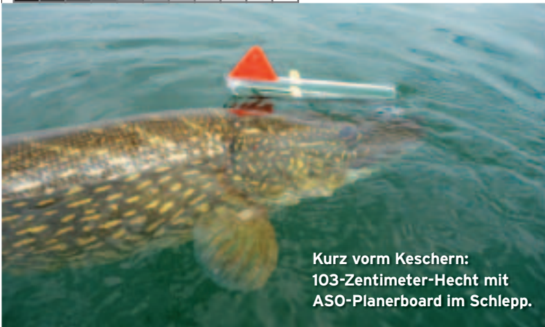
Kurz vorm Keschern: 103-Zentimeter-Hecht mit ASO-Planerboard im Schlepp.