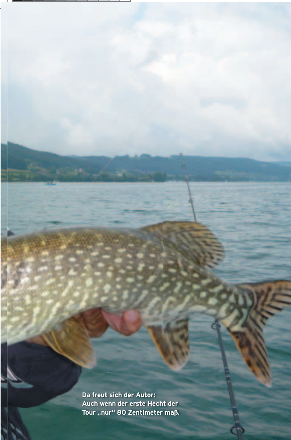
Da freut sich der Autor: Auch wenn der erste Hecht der Tour „nur“ 80 Zentimeter maß.

Schleppfischen auf Hecht, Felchenangeln, aber auch einmal mit der Spinnrute die Scharkante abfischen.