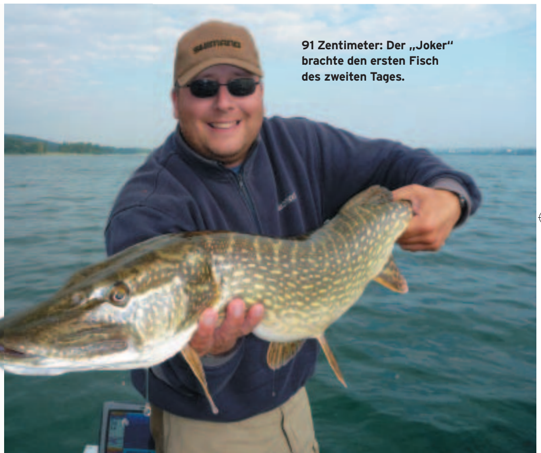
91 Zentimeter: Der „Joker“ brachte den ersten Fisch des zweiten Tages.

Kaum hatten wir den letzten Esox gelandet, frischte der Wind urplötzlich und ohne Vorwarnung erneut auf. Nach kurzer Zeit wurde die Windstärke 6 erreicht, und wir konnten kaum noch die Köder kontrollieren. Also ließen wir uns in Richtung Horn treiben, räumten das Schleppgeschirr ein und legten uns schließlich ordentlich in die Riemen, um nicht an der Landspitze vorbeizuschießen. Das Ergebnis des kurzen Tages konnte sich mit 14 Bissen und neun gelandeten Fischen sehen lassen. →