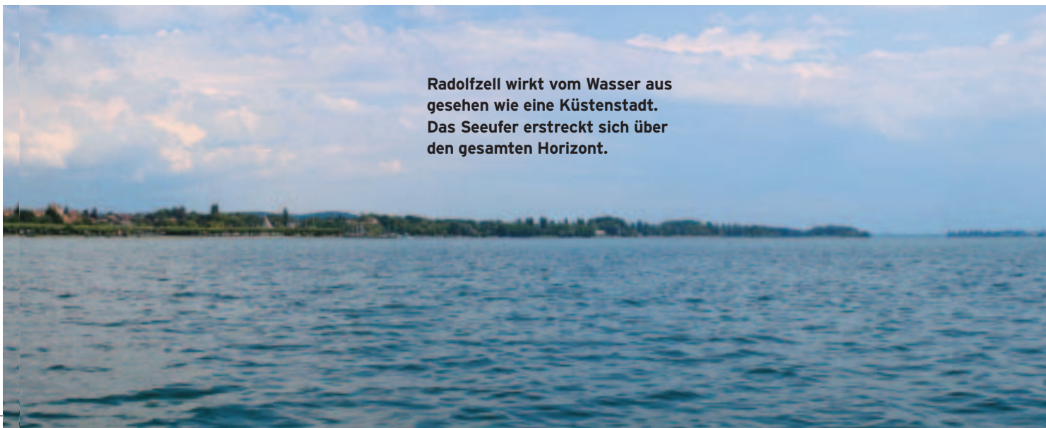
Radolfzell wirkt vom Wasser aus gesehen wie eine Küstenstadt. Das Seeufer erstreckt sich über den gesamten Horizont.