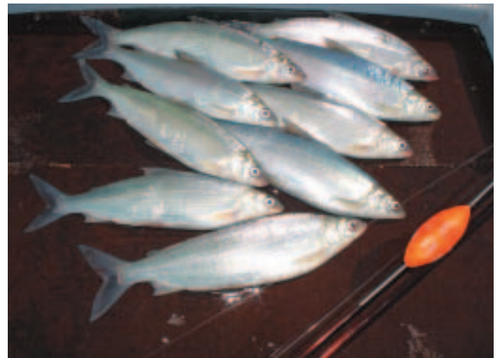
Schöne Silberlinge: Neun Renken konnten den Nymphen nicht widerstehen.