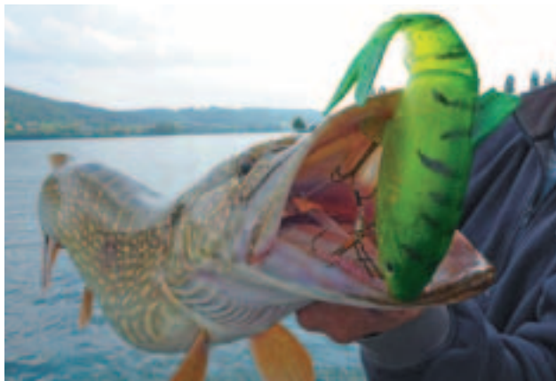
Riesenfutterluke: Gerade so passt der große Musky Innovations Shad Clone in das Maul des 96er Hechts.