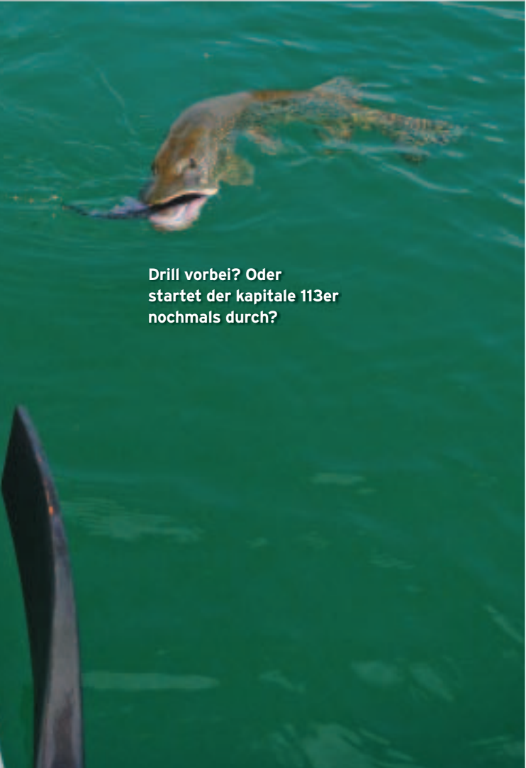
Drill vorbei? Oder startet der kapitale 113er nochmals durch?