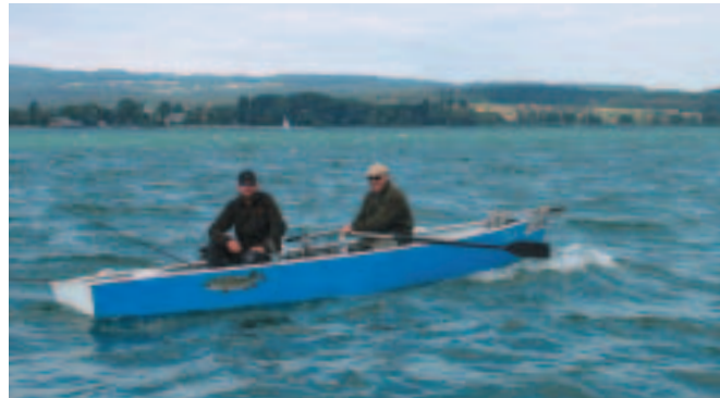
Aufkommender Wind: Im Zweifel lieber das Ufer aufsuchen.

don und ein 23 Zentimeter Spro Shad in Firetiger zum Einsatz, und nach fünf Minuten kämpfte schon der nächste Großhecht an der Angel. Dieses Mal ein schlanker 110er, den mir Herbert in die Kamera hielt. Ich war wirklich beeindruckt, zumal wir immer noch neues Wasser durchpflügten und mitten auf dem See fuhren. Fotos machen, Filmen, Köderwechsel, Kraut abmachen, GPS-Punkte speichern, Fänge notieren, mit den anderen Booten Erfahrungen austauschen und ab und zu auch mal einen Fisch drillen - da sage mal einer, Angeln sei entspannend. Den Stress nahmen wir natürlich gerne in Kauf, und unser Adrenalinspiegel war bestimmt rekordverdächtig.