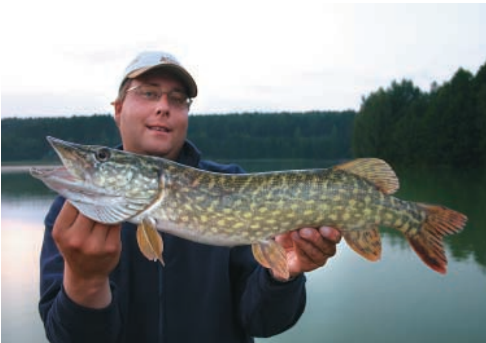
Und schon hat's geklappt: Zwar kein richtig Kapitaler, aber doch ein schöner Esox.

✓ Informationen: Siehe „Lizenzen“ sowie im Internet unter www.specimen-fishing-franken.de