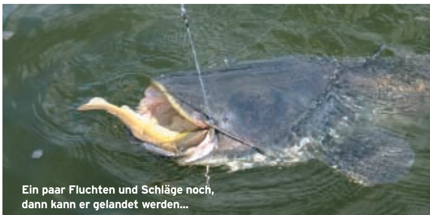
Ein paar Fluchten und Schläge noch, dann kann er gelandet werden...